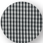
Pied-de-coq noir/blanc (33)

TAILLE ÉLASTIQUÉE AVEC CORDON DE SERRAGE INTÉGRÉ