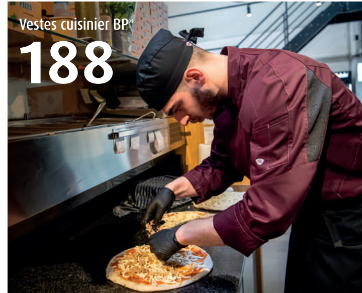
Vestes cuisinier BP® 188

Pour tous ceux qui accomplissent de grandes choses en cuisine : des vestes de cuisine modernes – offrant une liberté de mouvement maximale, des détails fonctionnels intelligents et une aptitude au lavage industriel conforme à la norme ISO 15797.