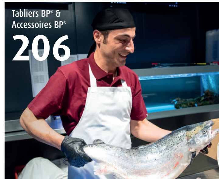
Tabliers BP® & Accessoires BP® 206

Le complément idéal pour la cuisine, le service et le comptoir : nos tabliers et accessoires apportent la touche finale parfaite à votre tenue.