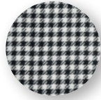
Pied-de-coq noir/blanc (33)