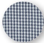
Pied-de-poule bleu/blanc (18)

MÉLANGE DE MATÉRIAUX RÉSISTANT ET FACILE D'ENTRETENIR